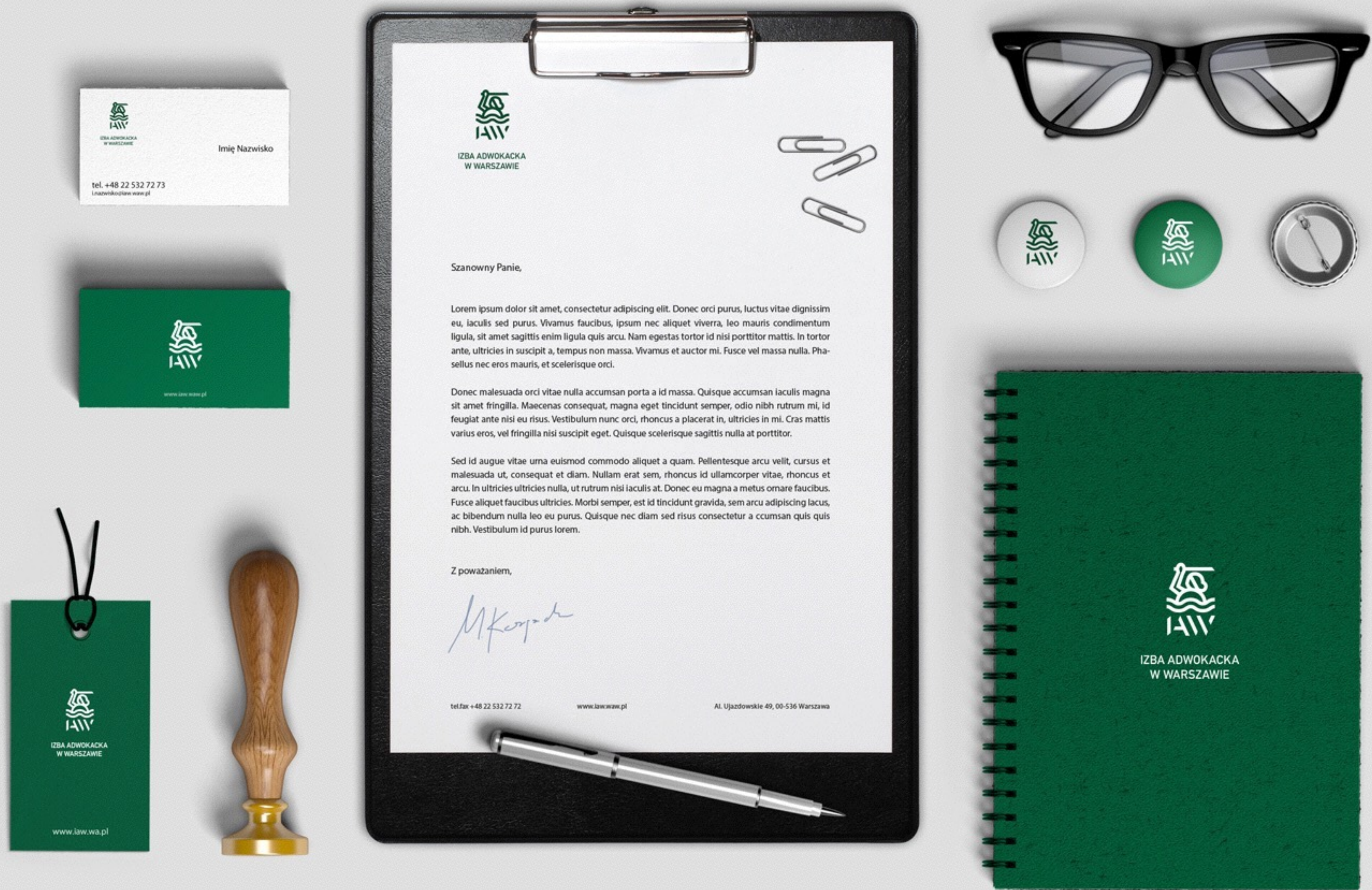
Przykładowe zastosowanie logo na materiałach biurowych.